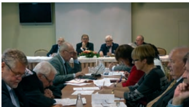
Fot. 1. Posiedzenie Zarządu Głównego PZITB

Wtorkowy program był bardzo napięty już o 9.00 rano rozpoczęło się posiedzenie Zarządu Głównego PZITB.