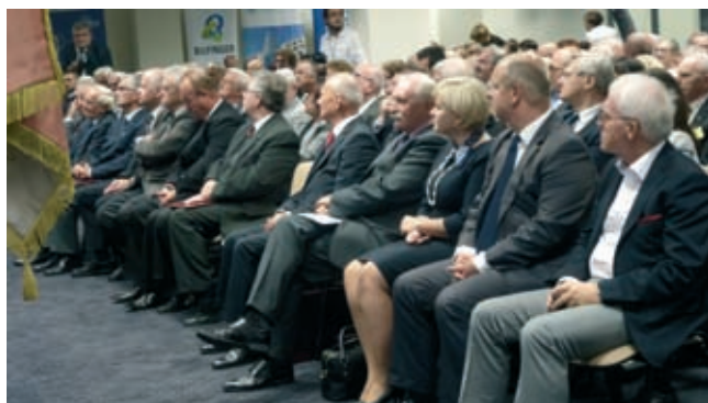
Fot. 4. Goście zaproszeni na uroczystą część Zjazdu